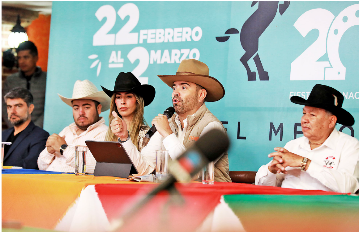
Rueda de prensa para presentar la Fiesta Internacional del Caballo, FICTlajo 2025.

El ingreso al festival tendrá un costo de 30 pesos para los adultos, mientras que, para las niñas y niños, el acceso será gratuito; además, parte de lo que se recaude irá directamente para reforzar los programas asistenciales que lleva a cabo el DIF de Tlajomulco. La FICTlajo 2025 contará con cabalgatas, exposiciones, competencias, clínicas, conciertos, gastronomía, juegos mecánicos y granja infantil entre otras actividades.